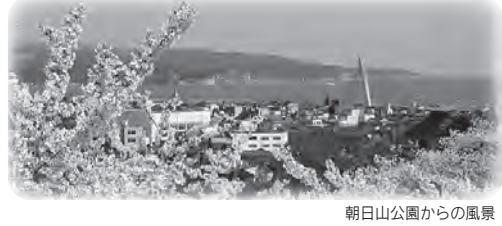
朝日山公園からの風景