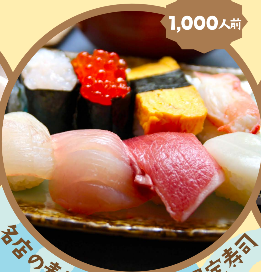
名店の寿司職人が握る限定寿司